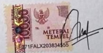
Azizah Nur Halimah