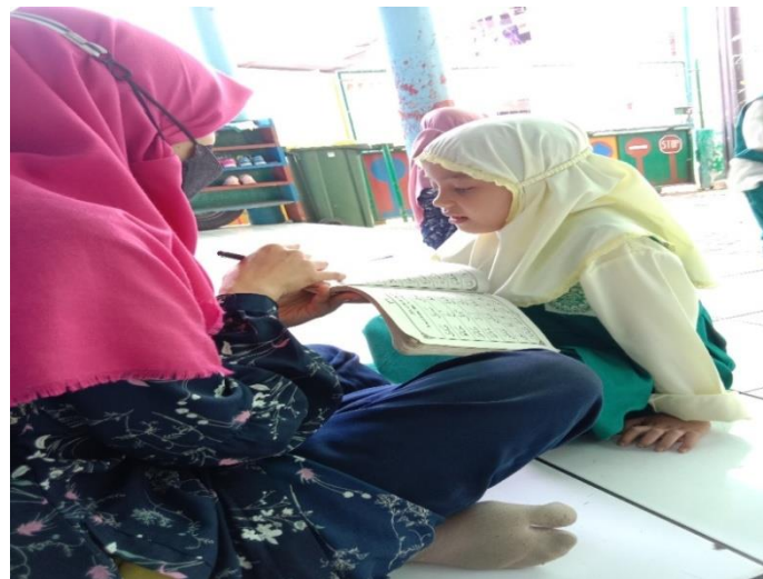
Kegiatan Penanaman nilai keagamaan (pembacaan iqro)