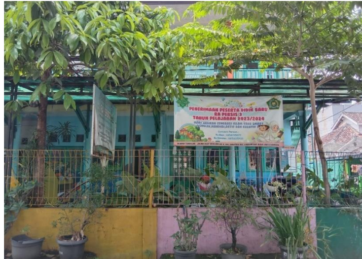
Profil RA Persis 3 Kota Bandung