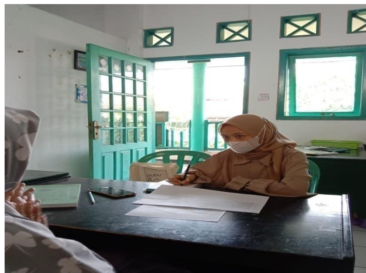
Kegiatan wawancara dengan kepala sekolah