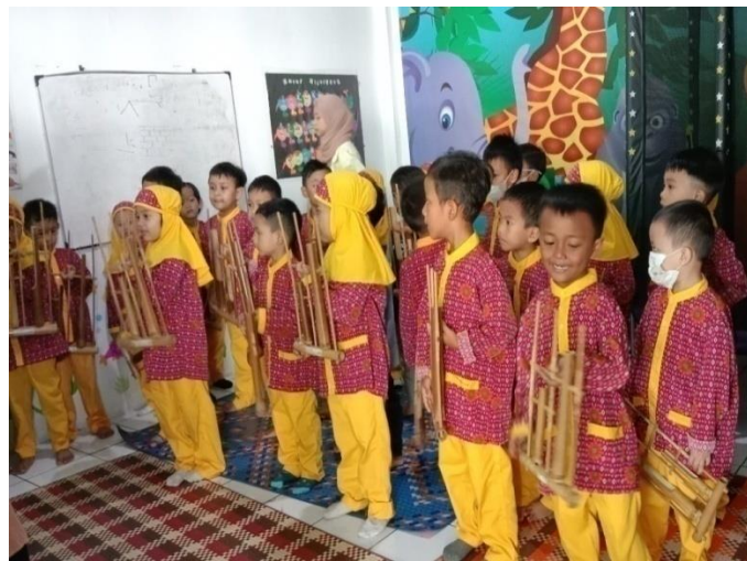
Kegiatan ekstrakurikuler angklung