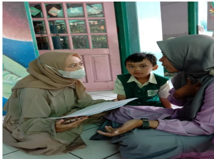
Kegiatan wawancara dengan guru kelas B2