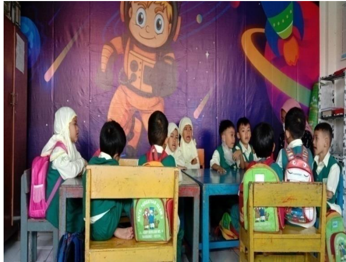
Kegiatan penanaman nilai keagamaan (berdo'a sebelum pelajaran di mulai)