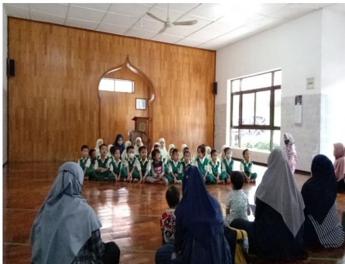
Kegiatan Pengajian mingguan bersama dengan orang tua siswa