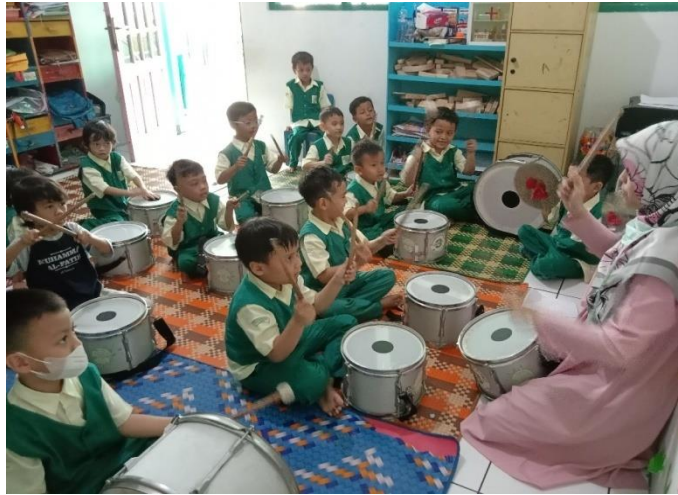
Kegiatan ekstrakurikuler marching band