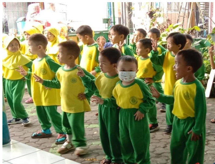
Kegiatan senam sebelum memasuki kelas