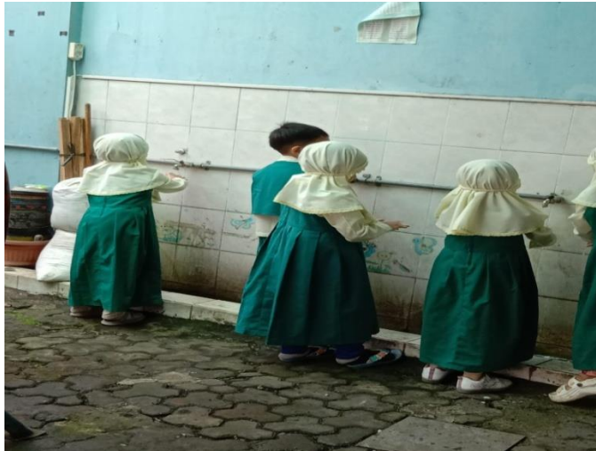
Kegiatan penanaman nilai kebersihan (mencuci tangan sebelum makan)