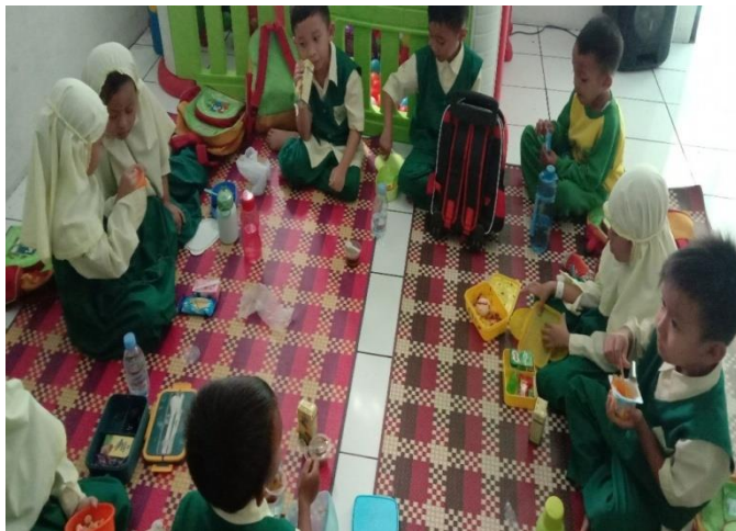
Kegiatan penanaman nilai kesopanan (makan dan minum dengan duduk)