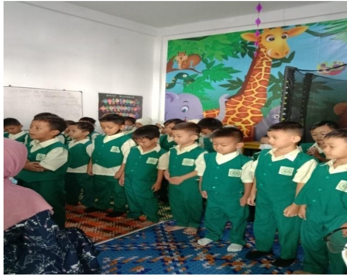
Kegiatan senam sebelum memasuki kelas