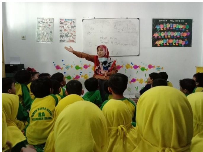
Kegiatan penanaman nilai keagamaan (metode bercerita keteladanan kisah para nabi)