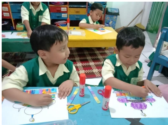
Proses kegiatan belajar mengajar di dalam kelas