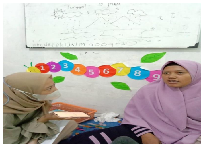
Kegiatan wawancara dengan guru kelas A