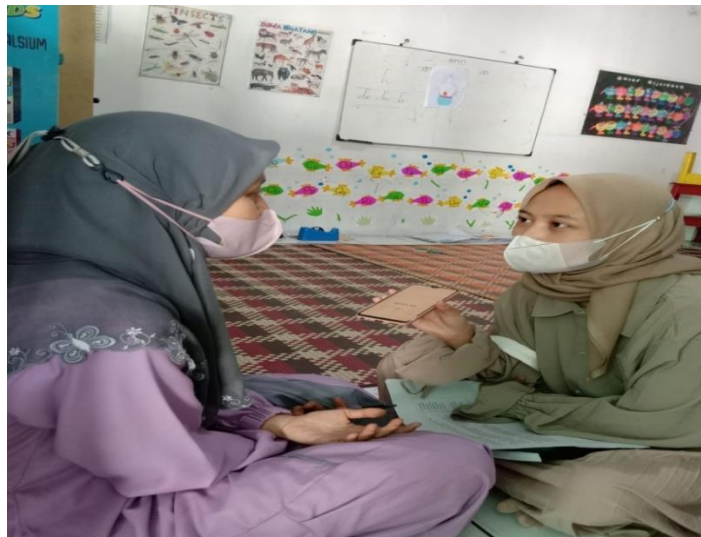
Kegiatan wawancara dengan guru kelas B1