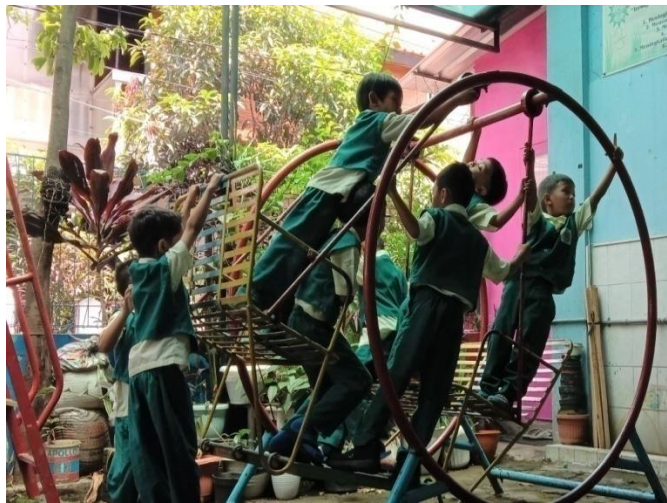
Kegiatan bermain di luar ruangan