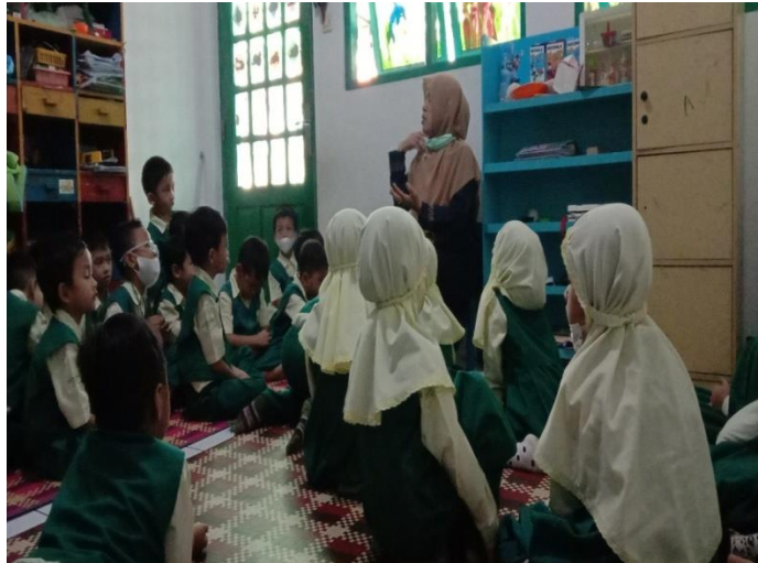
Kegiatan penanaman nilai keagamaan (pembacaan surat surat pendek juz 30)