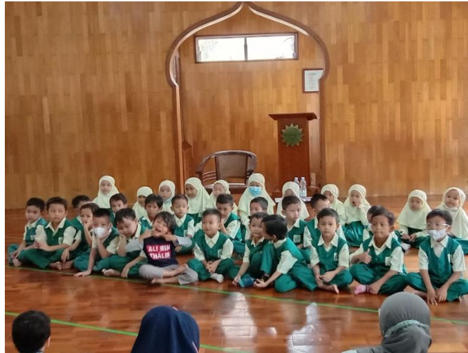
Kegiatan penanaman nilai keagamaan (pembacaan hafalan juz 30)