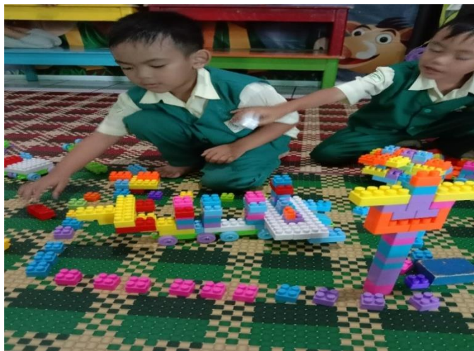
Kegiatan bermain di dalam ruangan