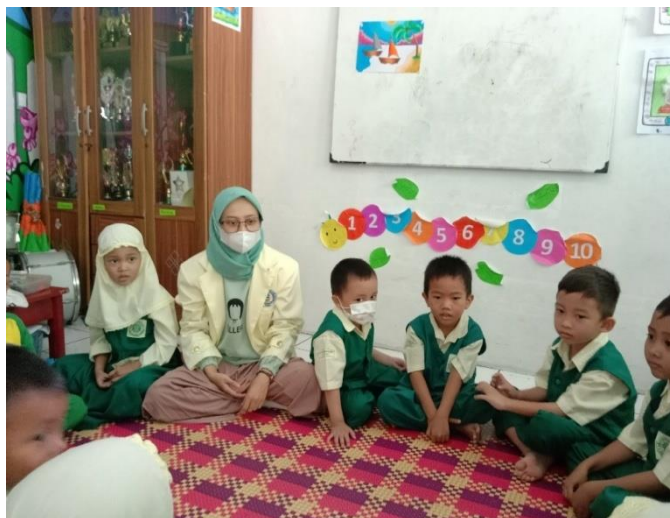
Kegiatan penanaman nilai keagamaan (berdo'a sebelum pulang)