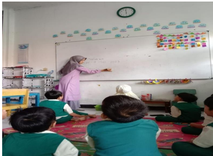
Proses kegiatan belajar mengajar di dalam kelas